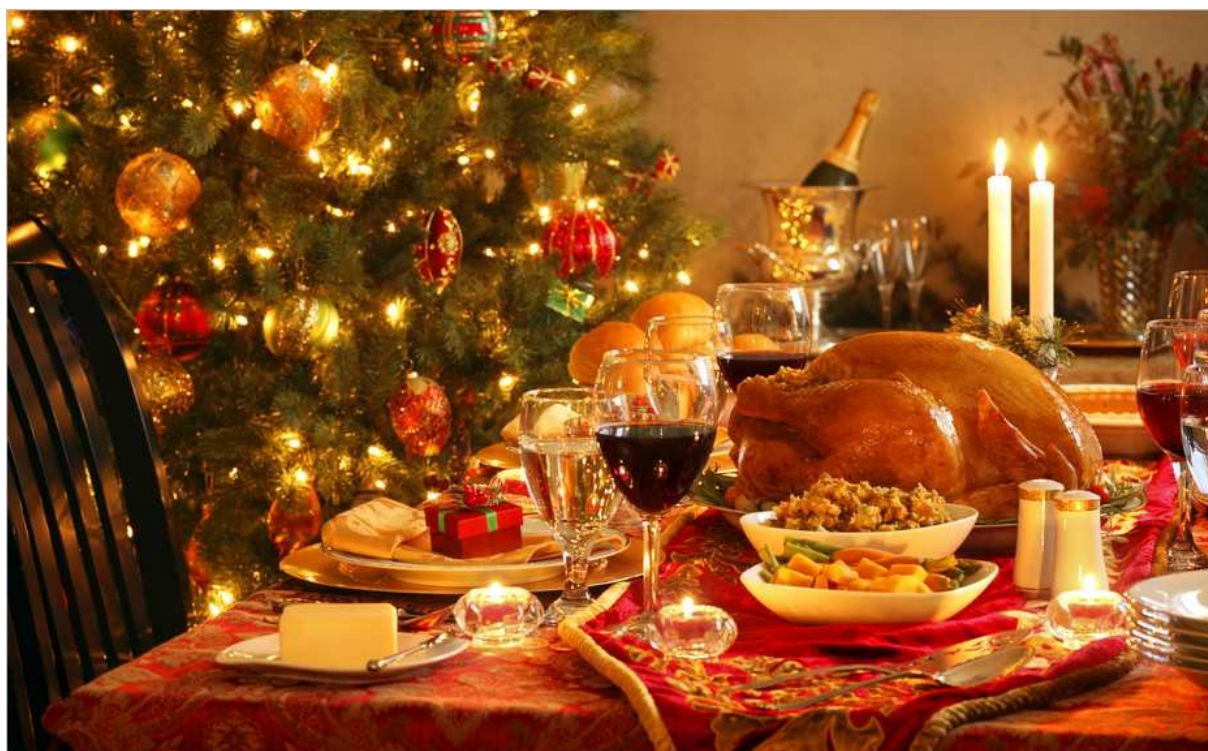
Bàn tiệc đêm Noël theo truyền thống của dân Pháp