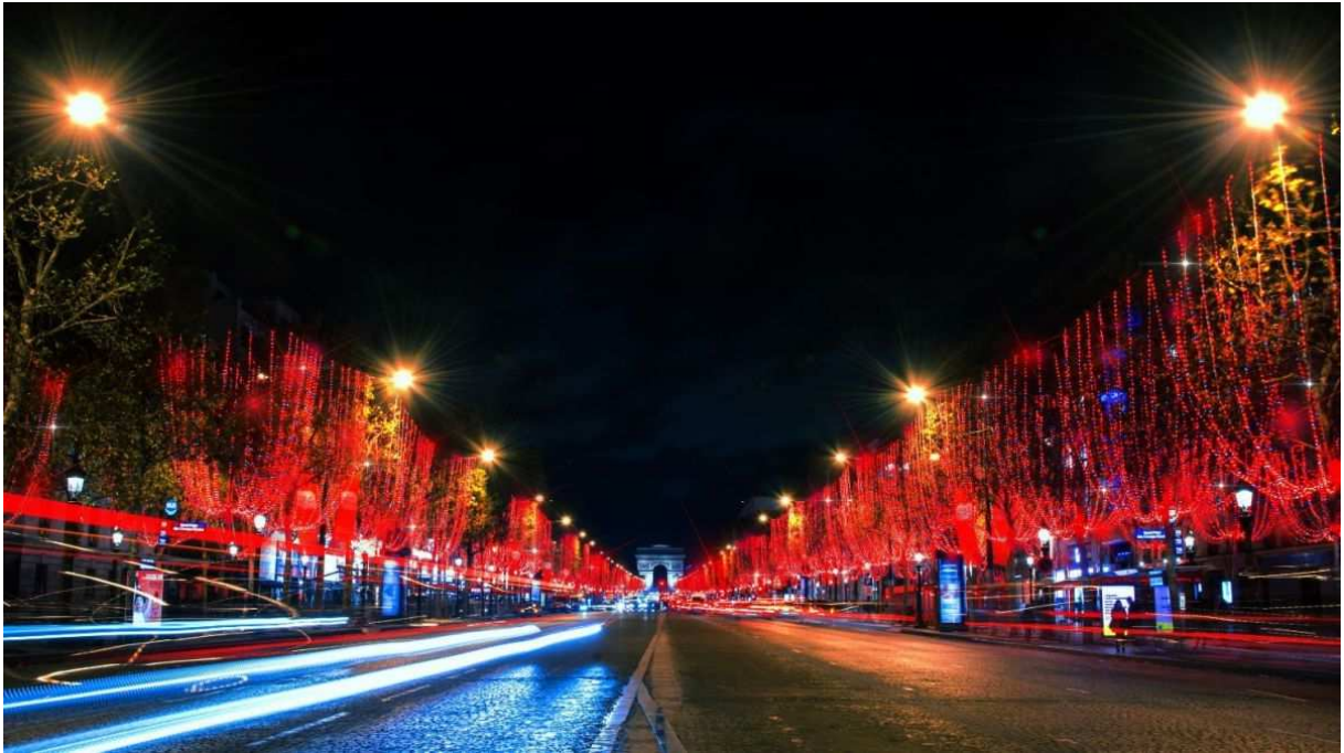
Đại lộ Champs-Élysées & Khải Hoàn Môn rực rỡ dưới ánh đèn màu