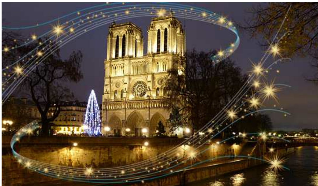
Thánh đường Notre-Dame Paris cổ kính bên bờ sông Seine