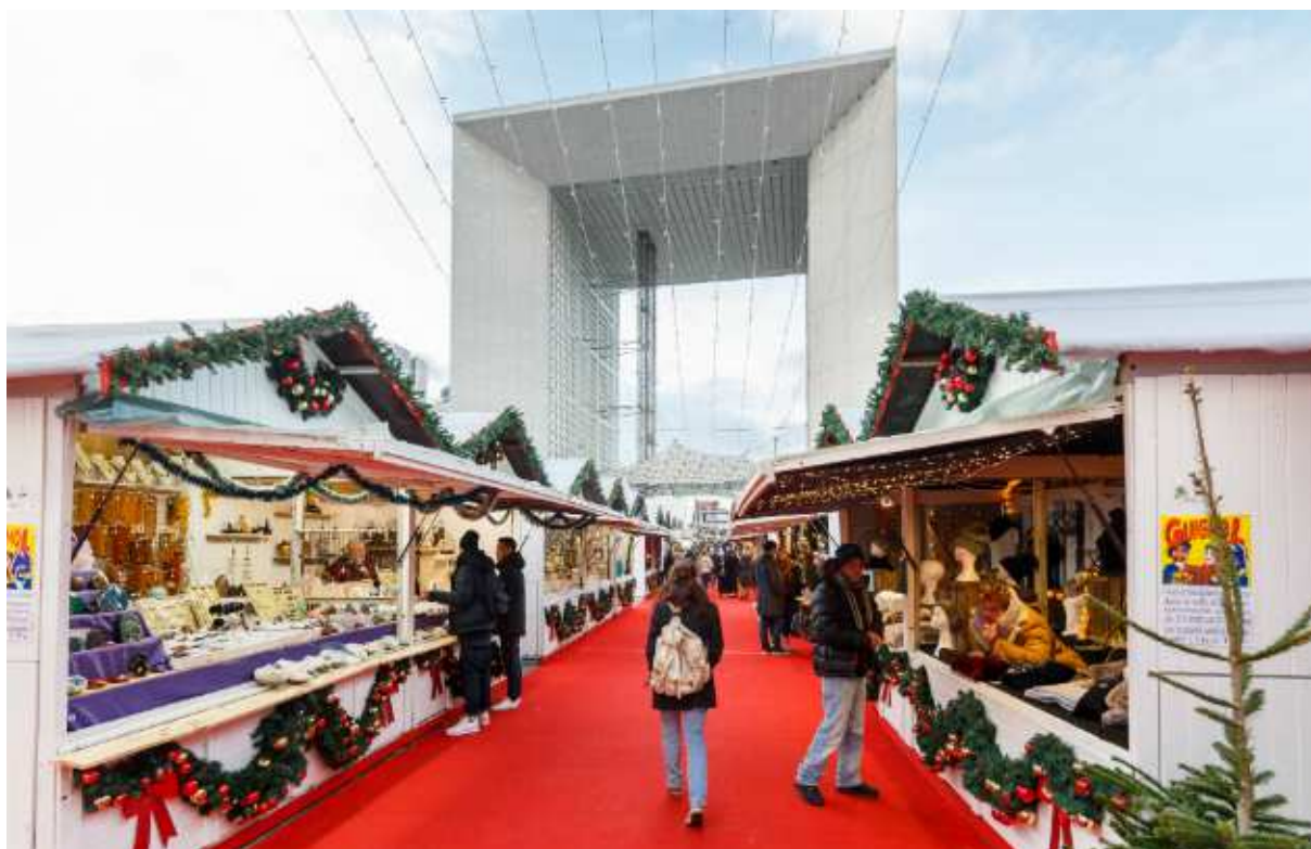
Làng Noël tại La Défense