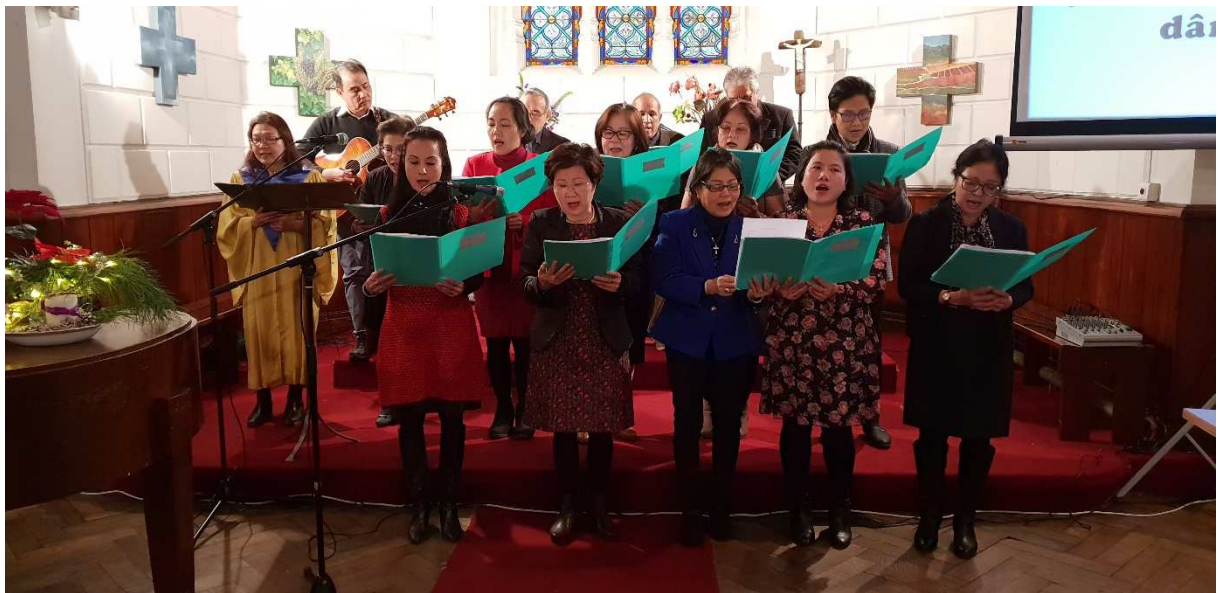
Hợp ca « Tình yêu Giáng Sinh » - Ban hát Trường Chúa Nhật (16/12/2018)