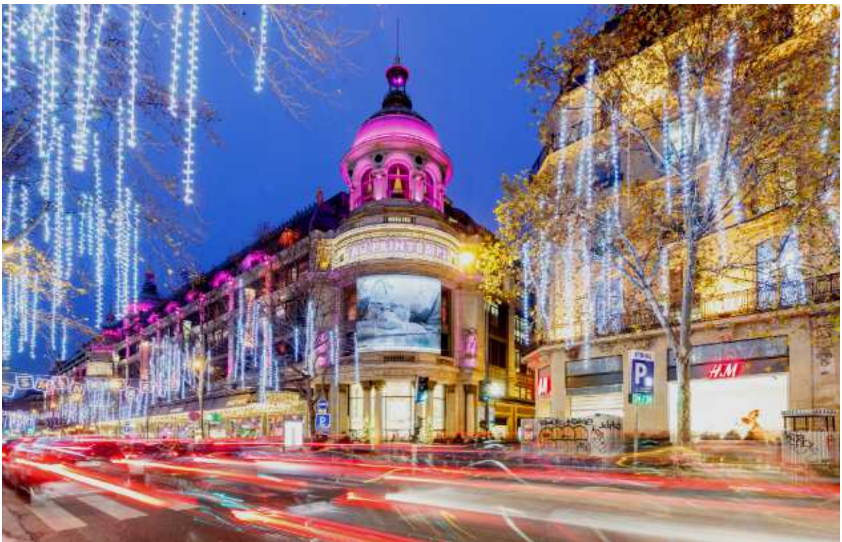
Đại lộ Haussmann với chuỗi cửa hàng cao cấp Printemps