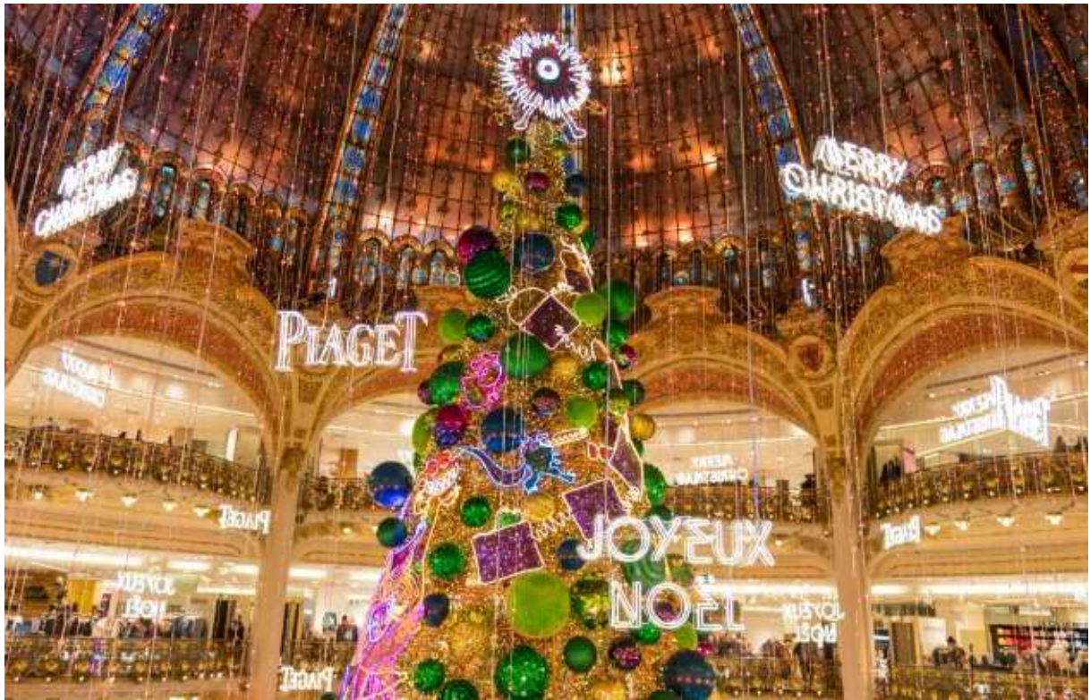
Cây thông Noël khổng lồ tại trung tâm cửa hàng Galeries Lafayette