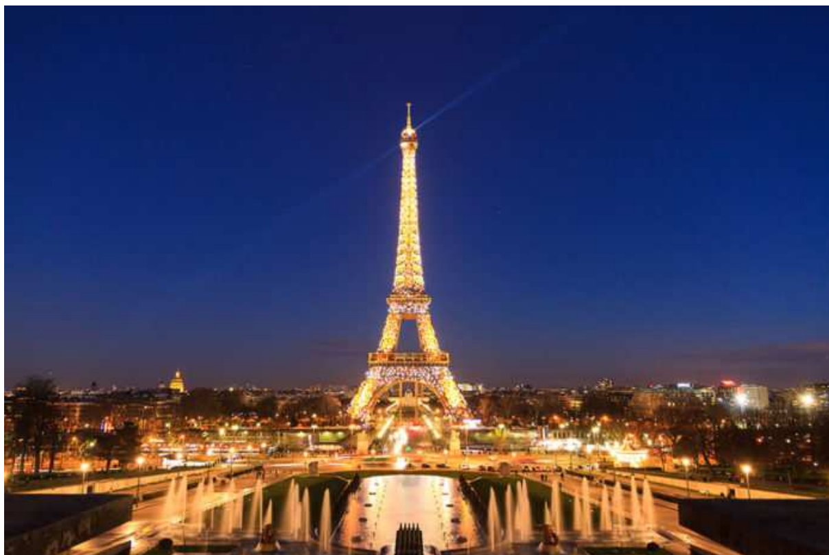
Tháp Eiffel lộng lẫy, nổi bật trên nền trời đêm.