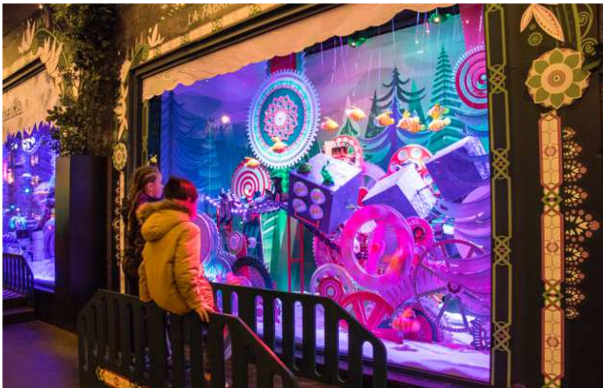
Các tủ kính trưng bày của Galeries Lafayette luôn là nơi thu hút các em nhỏ & du khách