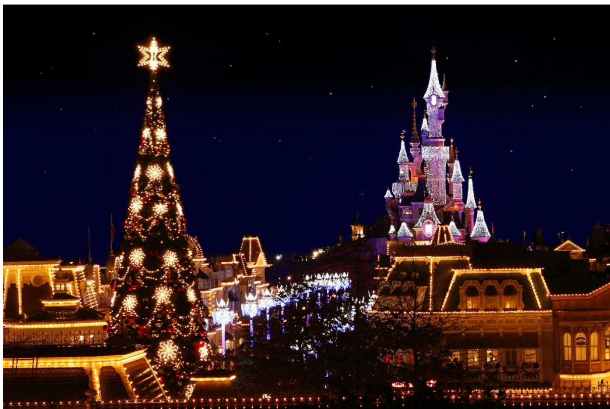
Lâu đài cổ tích & cây thông Noël tại công viên giải trí Disneyland Paris