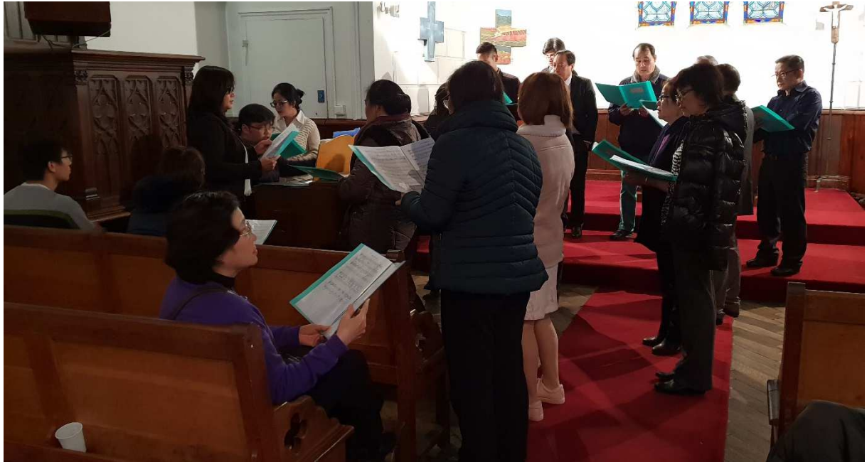
Tập hát chuẩn bị cho lễ Giáng Sinh (04/11/2018)